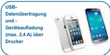
USB-Datenübertragung und -Geräteaufladung (max. 2,4 A) über Drucker